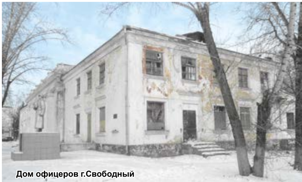
Дом офицеров г.Свободный

ДОРА: в чьем он ведении, какие перспективы его ожидают, какая работа ведется.