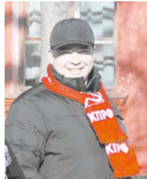
С уважением, первый секретарь Амурского обкома КПРФ Роман КОБЫЗОВ