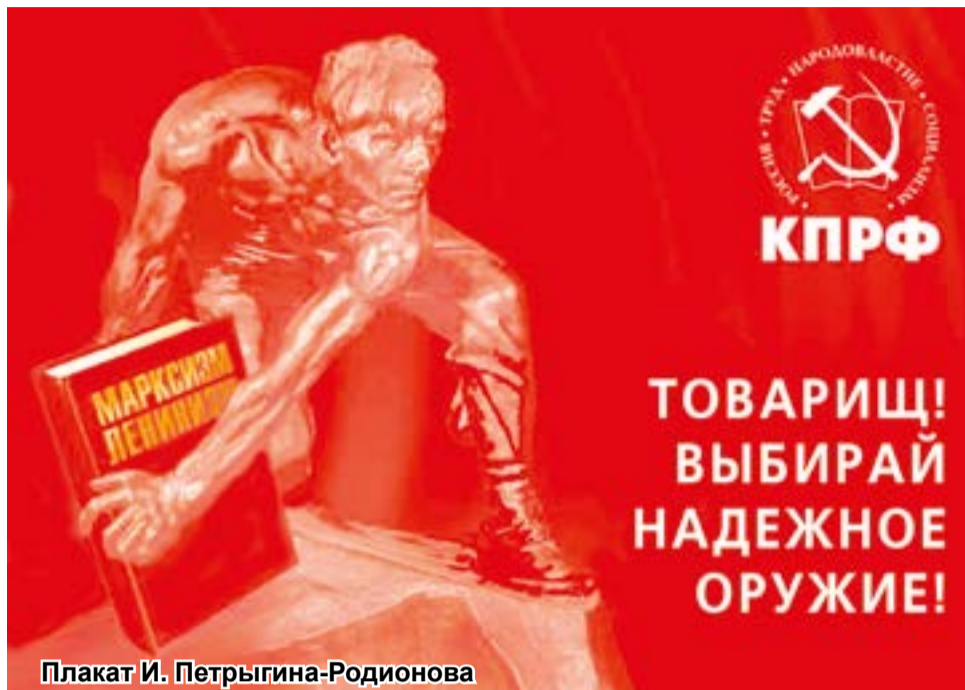
Плакат И. Петрыгина-Родионова

поговорить о перспективах учения с двухсотлетней историей.