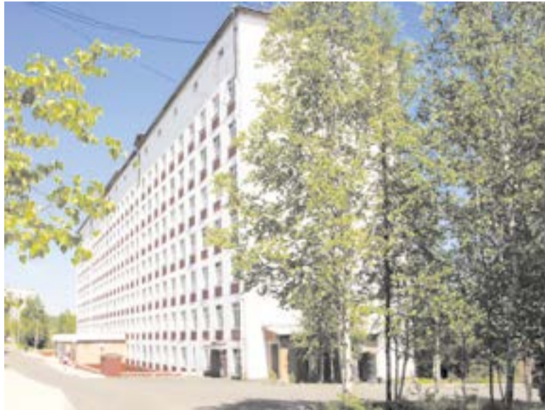
Здание стационара НУЗ «Отделенческая больница на станции Тынды», ставшее предметом спора чиновников

политического строя в России, ликвидацией одной из крупнейших железнодорожных магистралей в мире подверглась демонтажу и система здравоохранения на БАМе. Так и остались романтической мечтой новые больницы в Беркаките и Синегорье, закрылась противотуберкулезная лечебница. А весь фонд для лечения железнодорожников в Тынде и на трассе сейчас едва насчитывает триста коек.