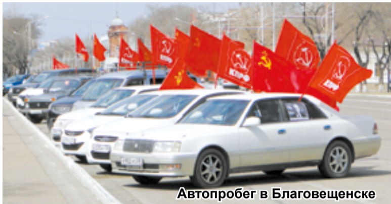
Автопробег в Благовещенске