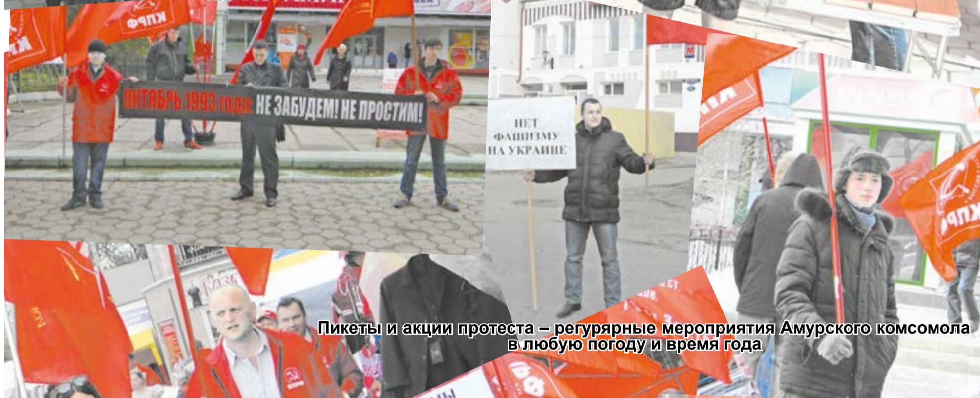
Пикеты и акции протеста – регулярные мероприятия Амурского комсомола в любую погоду и время года