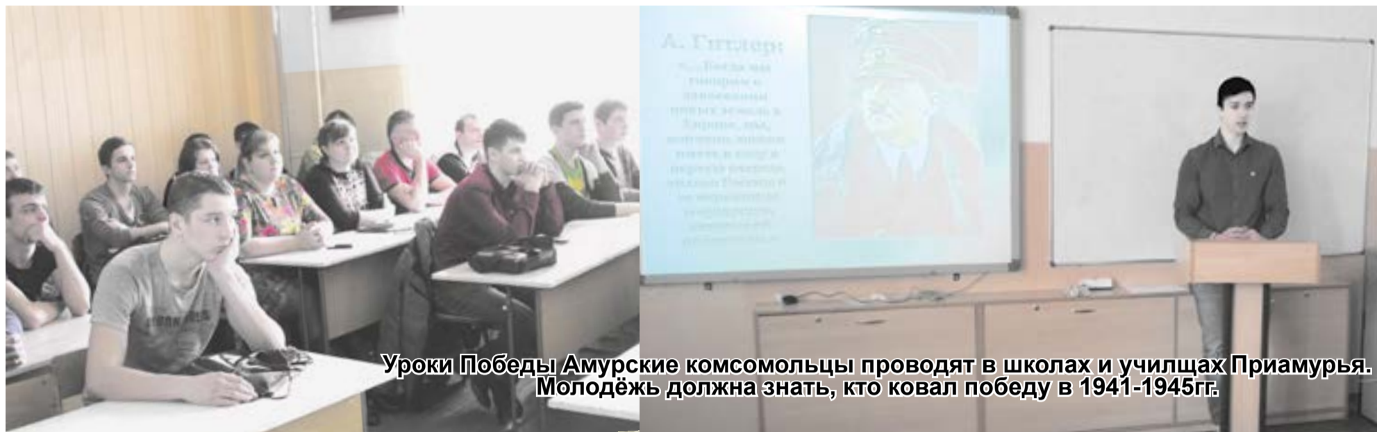
Уроки Победы Амурские комсомольцы проводят в школах и училщах Приамурья. Молодёжь должна знать, кто ковал победу в 1941-1945гг.